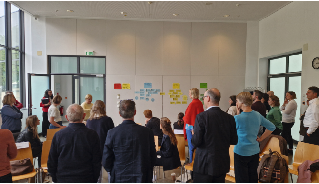
Intensiver Austausch am 11. Mai 2026 im Deutschen Museum in München